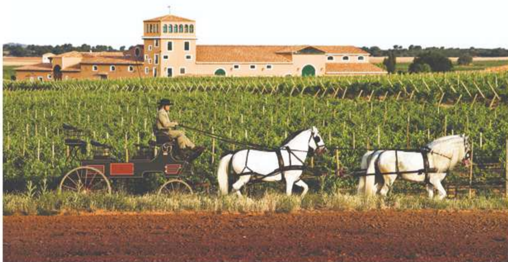
El III Congreso del COECM se celebrará los días 24 y 25 de marzo en Bodega Los Aljibes, de Chinchilla de Montearagón (Albacete).

El Congreso comenzará el jueves 24 de marzo en Bodega Los Aljibes, de Chinchilla de Montearagón, con un completo programa de conferencias técnicas y catas durante toda la jornada. Por la tarde, tendrá lugar la asamblea general del COECM y, posteriormente, la Cena de Gala en el Casino Primitivo de Albacete. Del mismo modo, el viernes día 25, también en Los Aljibes, se desarrollará durante la sesión de mañana la segunda parte del congreso con ponencias que pondrán de relieve la necesidad de que tradición e innovación vayan de la mano en beneficio del sector enológico y vitivinícola.