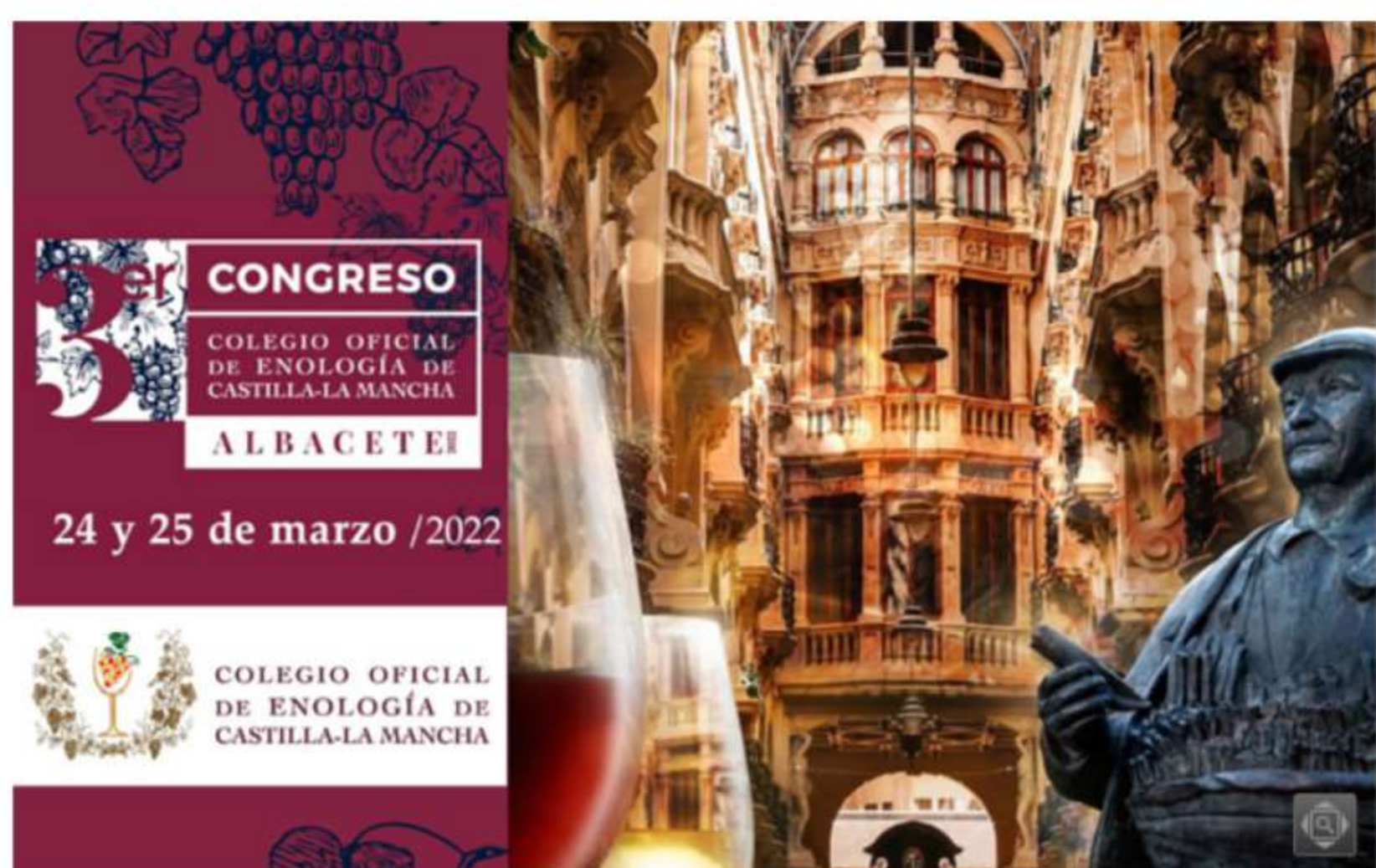
Albacete acogerá el III Congreso de Enólogos de Castilla-La Mancha los próximos 24 y 25 de marzo.