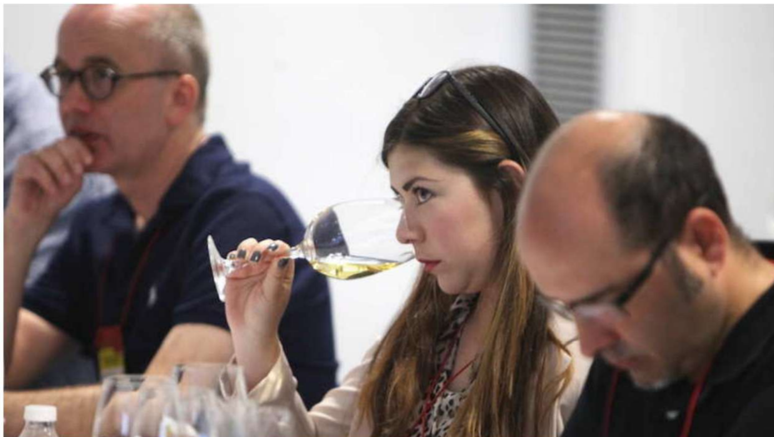
Albacete acoge el III Congreso de Enólogos de Castilla-La Mancha los días 24 y 25 de marzo

Durante estos dos días, se darán cita las principales personalidades y entidades del mundo del vino de la región y a nivel nacional, en una serie de conferencias y ponencias en torno al sector vitivinícola