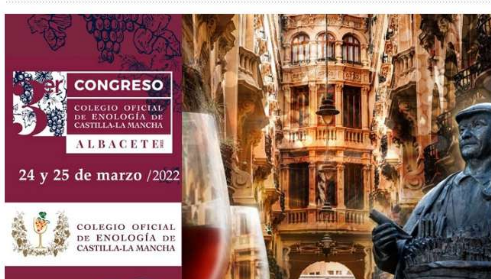
Cartel Congreso Enología 2022

Albacetecapital.com 15 de marzo de 2022-11:52h