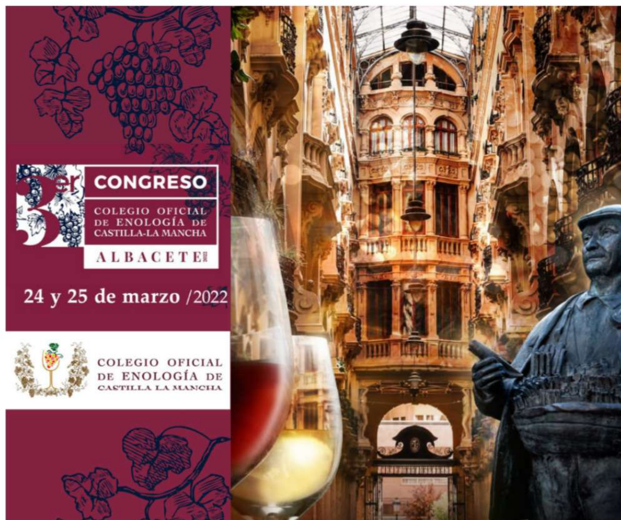
Imagen del cartel del Congreso / Lanza