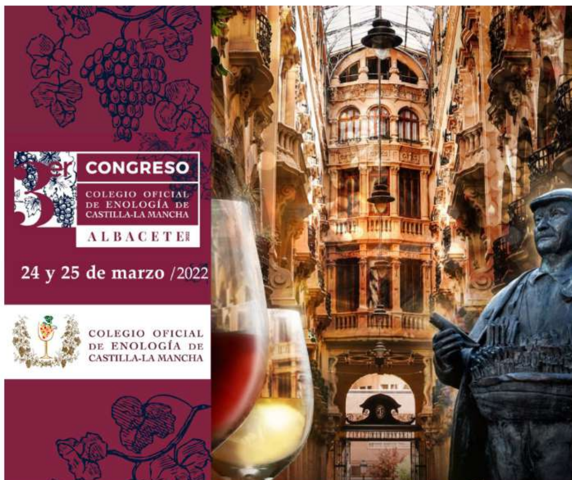
Cartel anunciador del III Congreso del Colegio de Enólogos de Castilla-La Mancha