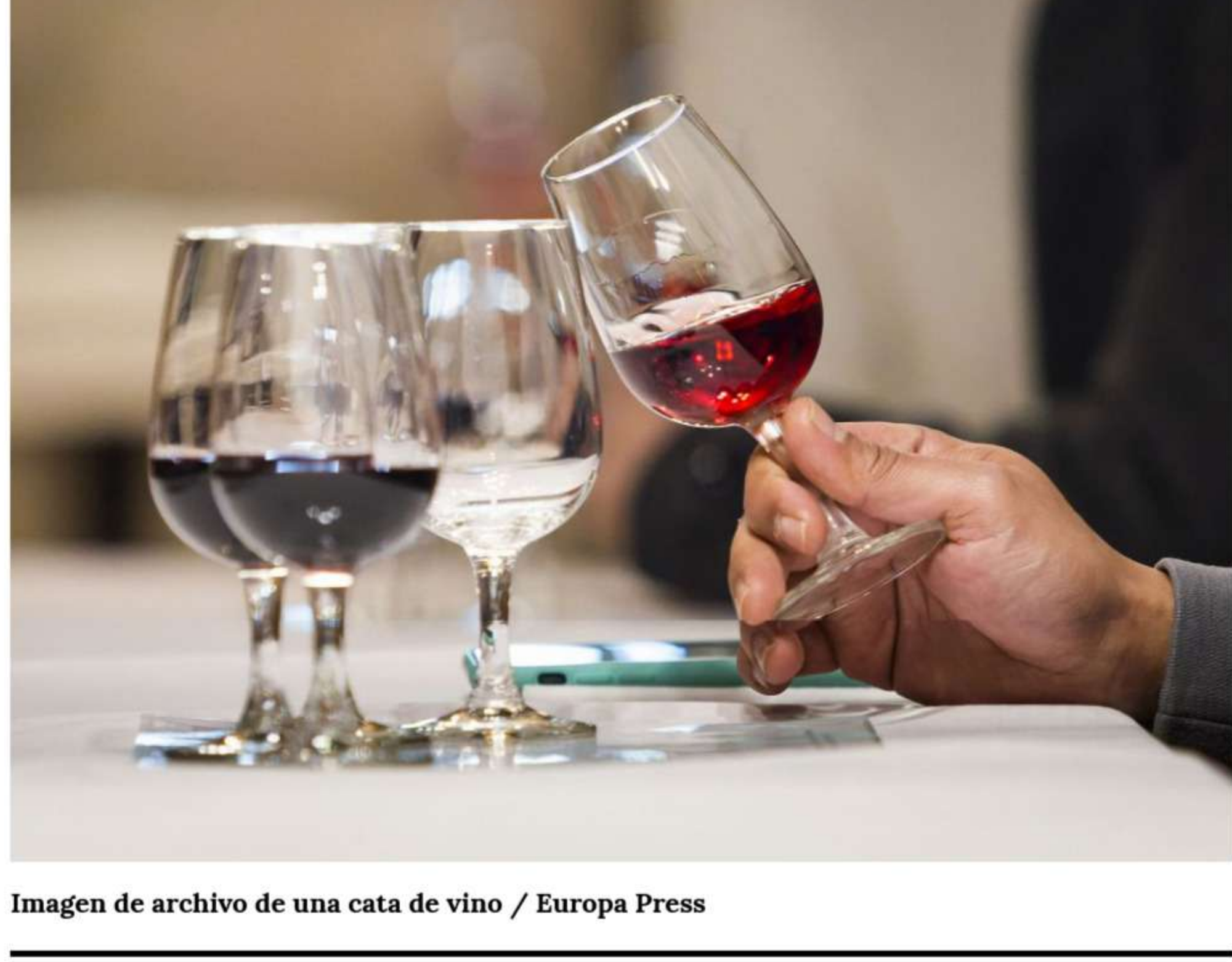
Imagen de archivo de una cata de vino