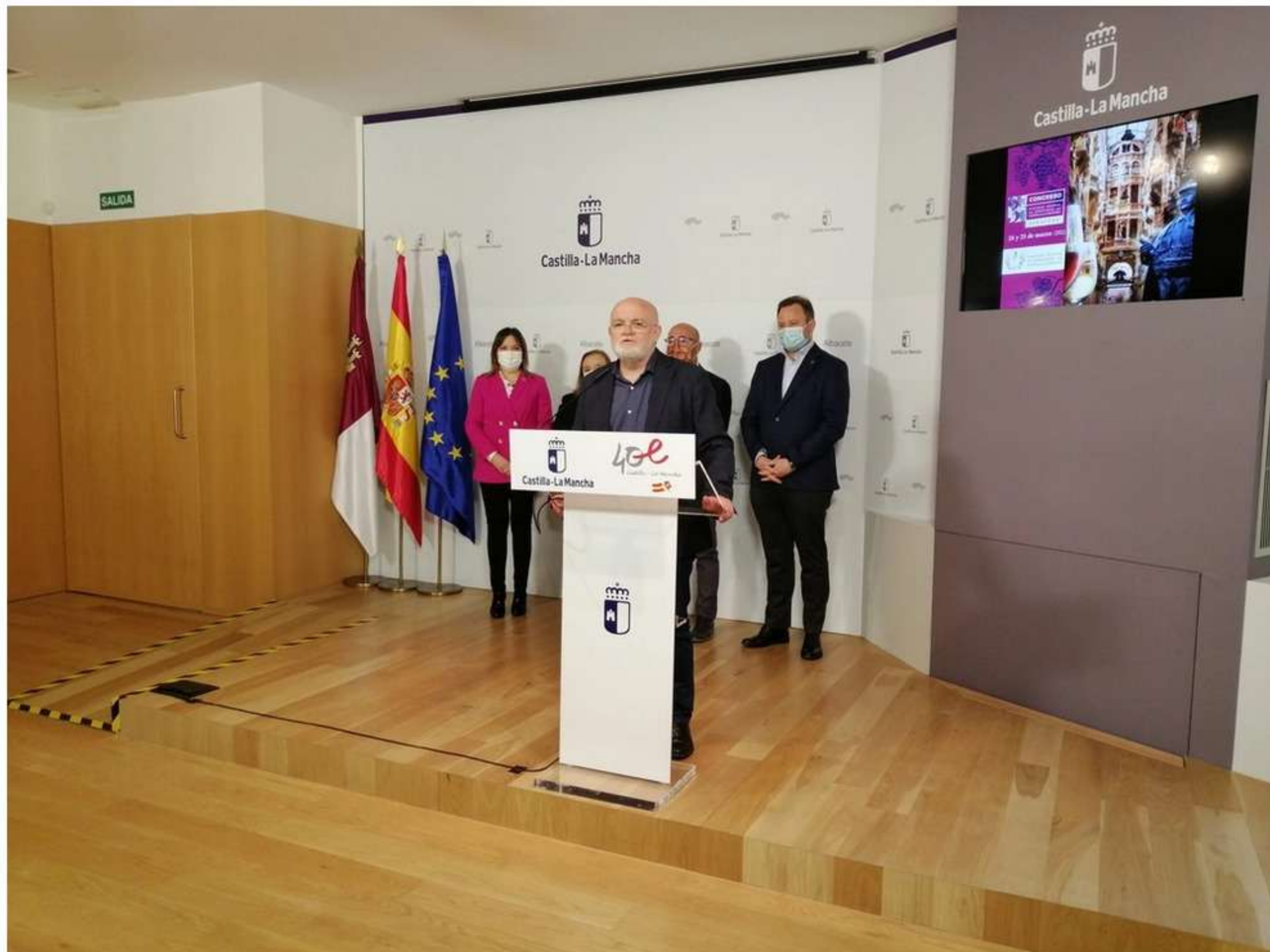
Presentación del Congreso de Enólogos

El Colegio de Enólogos de Castilla-la Mancha celebra el jueves y el viernes su congreso autonómico