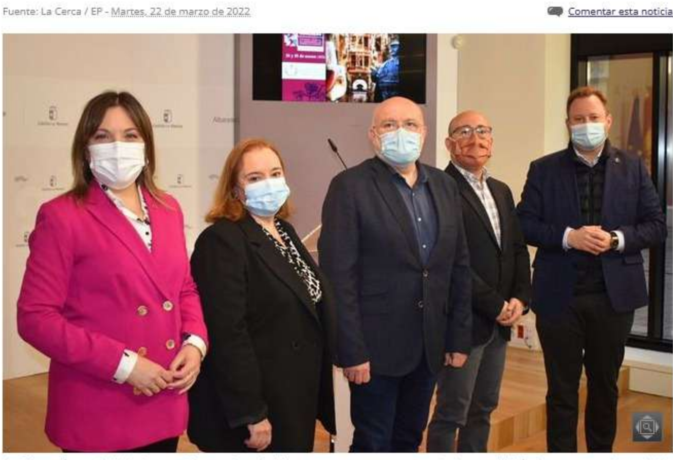
La Diputación provincial, la Junta y el Ayuntamiento de Albacete muestran su apoyo a todo el sector vitivinícola y reconocen el papel de la enología en la obtención de vinos de excelencia en Castilla-La Mancha.

Fuente: La Cerca / EP - Martes, 22 de marzo de 2022