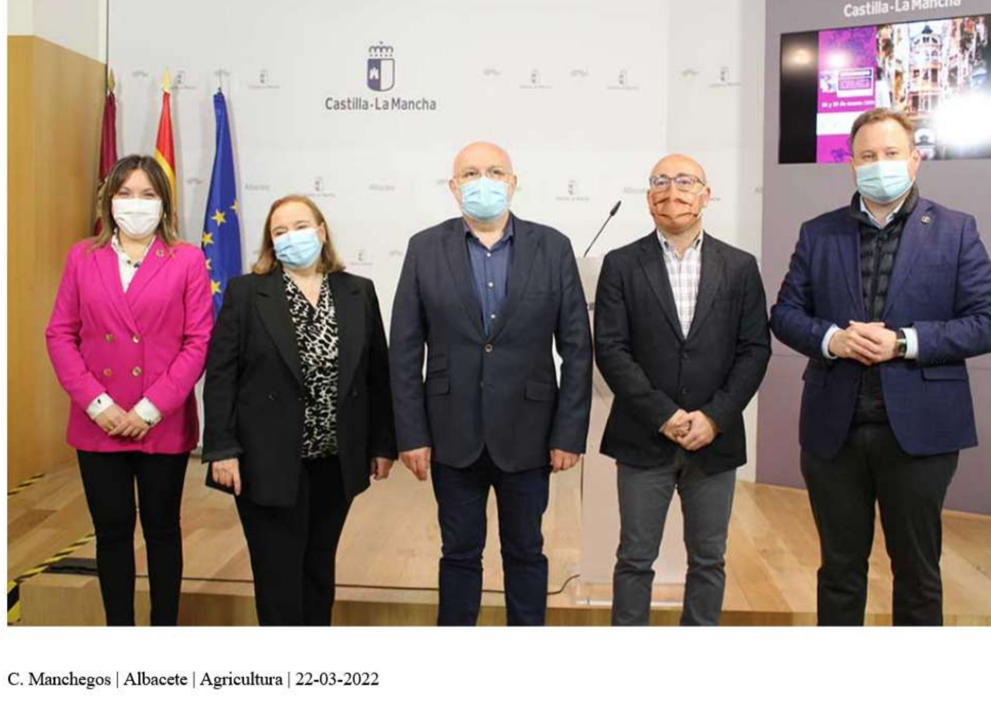
C. Manchegos | Albacete | Agricultura | 22-03-2022