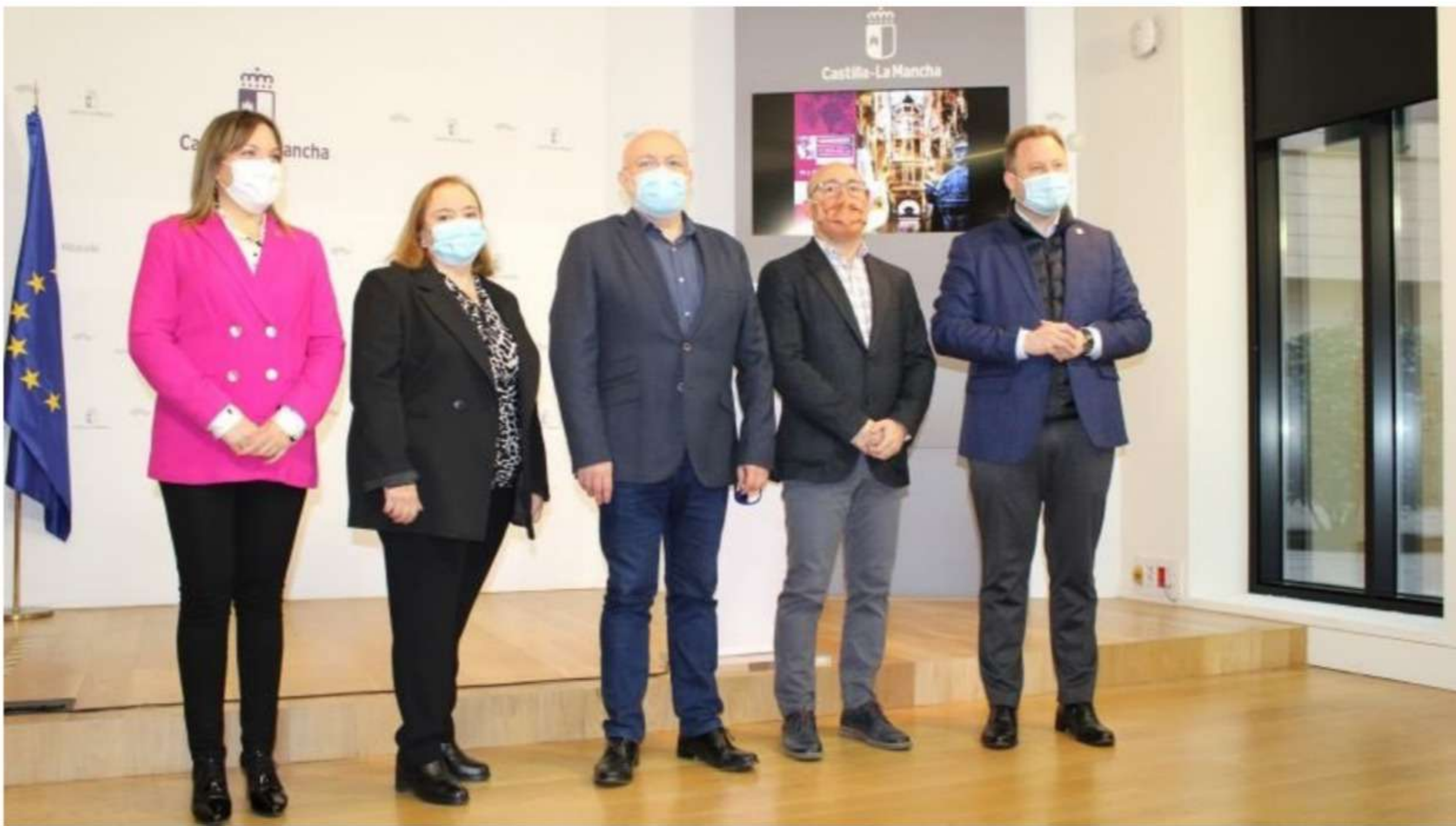
Albacete acoge el III Congreso del Colegio Oficial de Enología de Castilla-La Mancha

Un centenar de profesionales del vino pondrán en valor el sector en este III Congreso Oficial de Enología