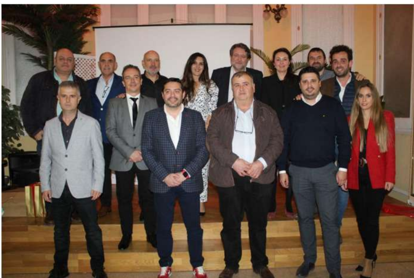
Foto de familia de los patrocinadores del Congreso del Colegio de Enólogos de Castilla-La Mancha