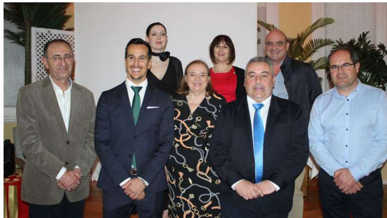
Junta Directiva. COECLM