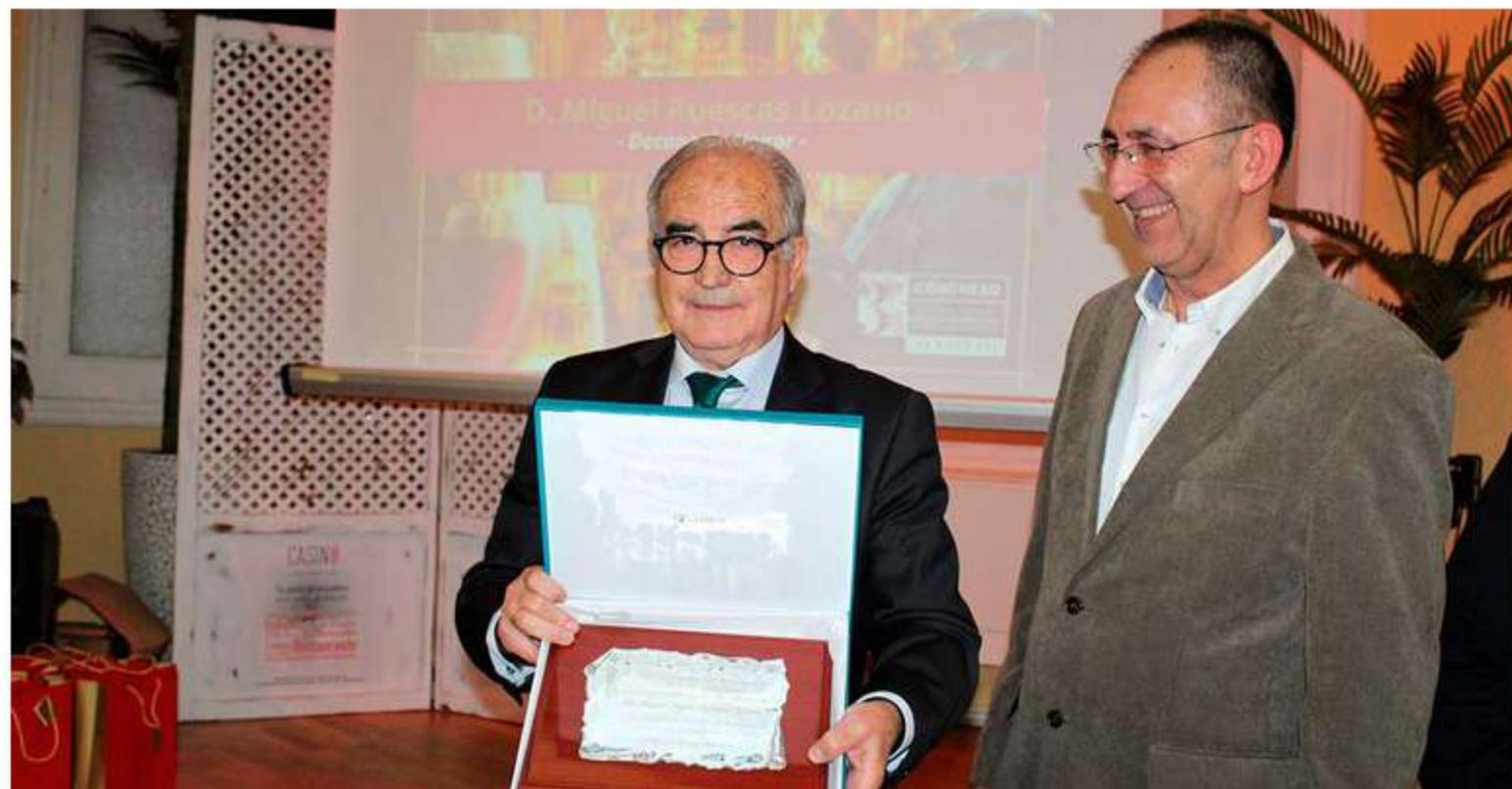
C. Manchegos | Albacete | Agricultura | 25-03-2022