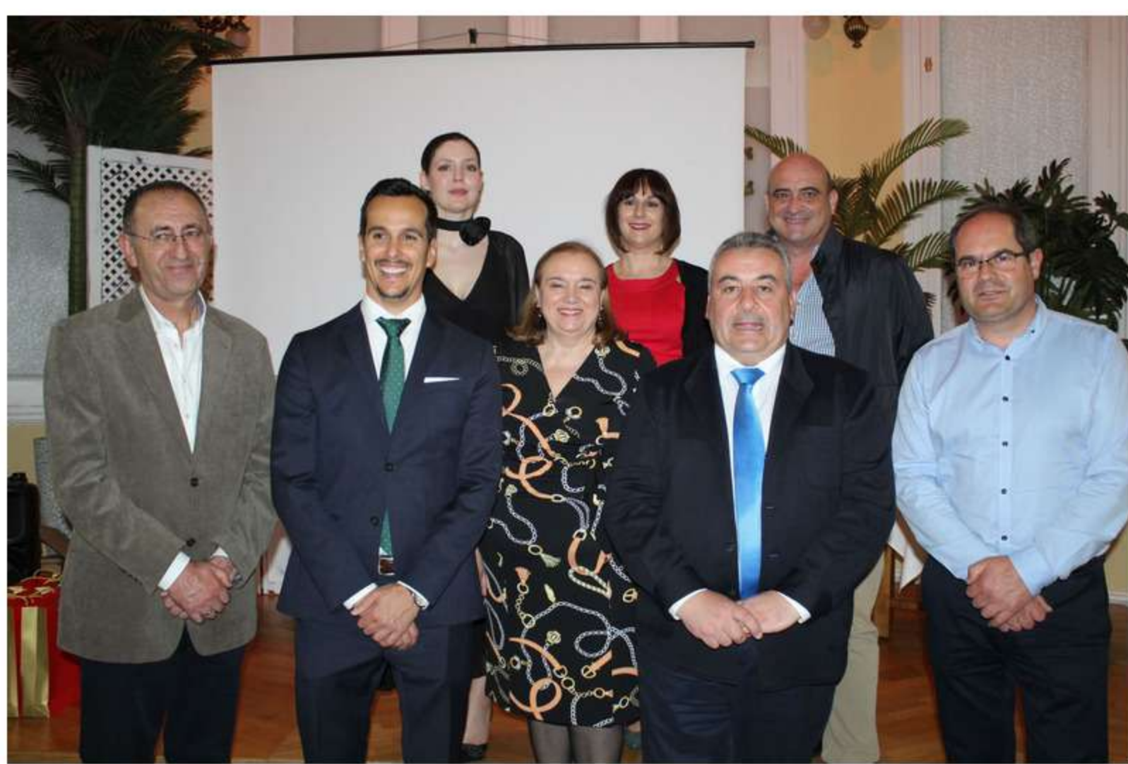
Junta Directiva del Colegio de Enología de Castilla-La Mancha

En su afán porque los enólogos fueran reconocidos como un pilar técnico fundamental de la bodega, contribuyó firmemente para que nuestra región contase con estudios superiores de formación de enólogos, siendo la implantación del Grado de Enología de la Universidad de Castilla-La Mancha su principal logro.