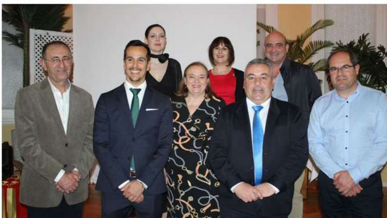
Junta Directiva. COECLM