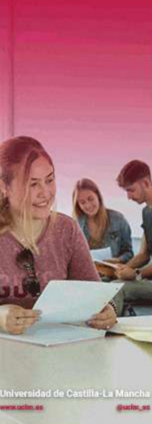
Universidad de Castilla-La Mancha www.uclm.es @uclm_es

Publicidad: Inscríbete en la jornada de puertas abiertas